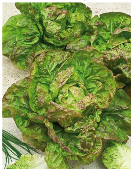
Laitue d'hiver brune passion