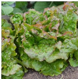
Batavia rouge grenobloise